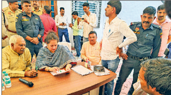
मंडी अटेली। जनता दरबार में लोगों की समस्याएं सुनी हुईं स्वास्थ्य मंत्री आरती सिंह राव। व नारियल फोड़कर शुभारम्भ करती स्वास्थ्य मंत्री आरती सिंह राव।

स्वास्थ्य मंत्री आरती सिंह ने वीरवार को अटेली में पॉवर हाउस के सामने अपने कार्यालय पर जनता दरबार लगाया। इस मौके पर उन्होंने लोगों की समस्याओं को सुना और उन के समाधान का आश्वासन दिया। इस जनता दरबार में ज्यादातर शिकायतें परिवार पहचान पत्र एवं बुढ़ापा पेंशन से संबंधित आईं। अटेली क्षेत्र की अनेक ग्राम पंचायतों ने पेयजल जैसी समस्याओं को मंत्री के सामने रखा। कार्यालय में विकलांग लोगों