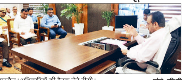
नारनौल। अधिकारियों की बैठक लेते डीसी।