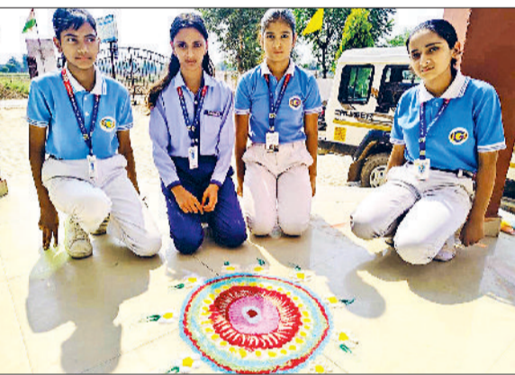
महेंद्रगढ़। रंगोली बनाती छात्राएं।