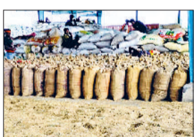
बाजरे के गेट पास जारी किए। जिनमें से 5306 किसानों की ओर से 162137 क्विंटल बाजरा बेचा गया। दूसरी तरफ बाजरा खरीद के लिए प्रारंभिक रूप से नियुक्त की गई एजेंसी हैफेड के अधिकारी फसल बंदरग होने की वजह से बाजरे की सरकारी खरीद नहीं कर रहे हैं। उनकी ओर से रेवाडी लैब में बाजरे के सैंपल भेजे जा रहे हैं। जो

हरिभूमि न्यूज ▶▶ कनीना अनाज मंडी में दीपावली के बाद भी बाजरे की आवक जारी है। किसान अब भी बाजारा लेकर मंडी में पहुंच रहे हैं। जिनके गेट पास जारी कर प्राइवेट एजेंट बाजरे की खरीद कर रहे हैं। ■ माह भर में 5306 स र का री 162137 क्विंटल खरीद न होने बाजरा बेचा की वजह से मंडी में करीब 15 एक्विटव प्राइवेट खरीद एजेंट 1850 से 1950 रुपये प्रति क्विंटल की दर से खरीद कर रहे हैं। 23 सितंबर से लेकर 23 अक्टूबर तक 5864 किसानों के 181366 क्विंटल