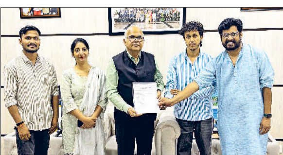
महेंद्रगढ़। कुलपति को शोध कार्य की जानकारी देते हुए।